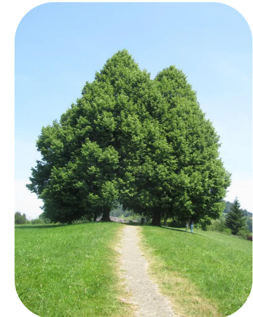
Birken, Eichen und Laubbäume

(«Pfaffenhütli», Schlehe oder Weissdorn )