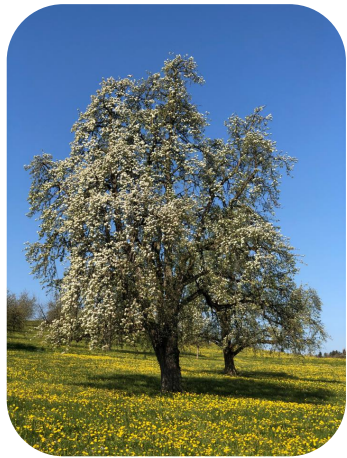
seltene Hochstamm- Obstsorten

( https://www.prospezierara.ch/pflanzen/sortenfinder.html )